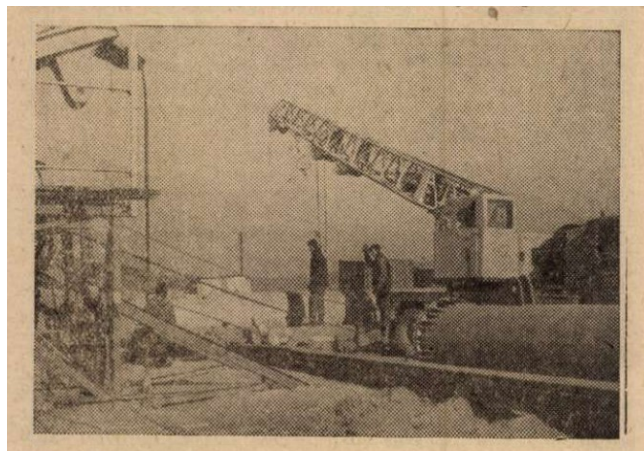
Toronszerelés anno – Zalai Hírlap 1960. február 20.